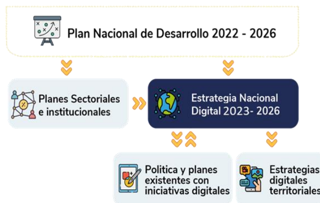
Figura 1. Construcción y articulación de la Estrategia Nacional Digital de Colombia 2023 – 2026

Por lo anterior, la END 2023 – 2026 aborda no solo las iniciativas que estará implementando el MinTIC, ente rector del sector de las Tecnologías de la Información y las Comunicaciones (TIC) y por tanto pilar de esta estrategia, sino también aquellas que estarán desarrollando las otras entidades del Gobierno nacional para impulsar la transformación digital de sus sectores. Lo anterior, entendiendo que la transformación digital es una apuesta a nivel país que involucra y requiere los esfuerzos de todos los sectores.