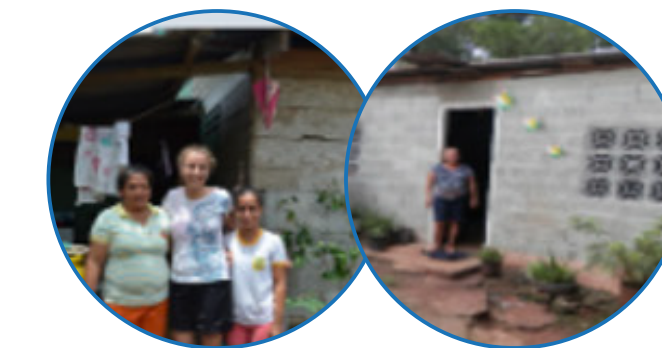
Foto antes y después