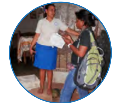
Reconocer la mejora