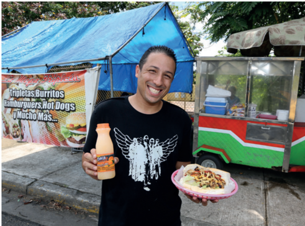
Puesto de venta de perritos calientes y bebidas.

Pero además los negocios de las personas que han estado acompañadas por Microfinanzas PR prosperan. Sus ventas crecen un 10% anual, el excedente de sus negocios sube en un 16% y los activos lo hacen un 20% en el mismo período de tiempo.